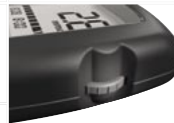
Multifunktions-Scrollrad für einfachste Bedienung