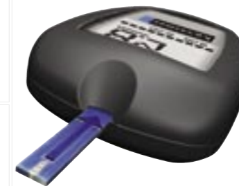
Spezial-Teststreifen für exakt definierte Blutmenge