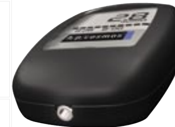
Schnittstelle zur Datenübertragung

Hersteller: SensLab GmbH Bautzner Straße 67, DE 04347 Leipzig